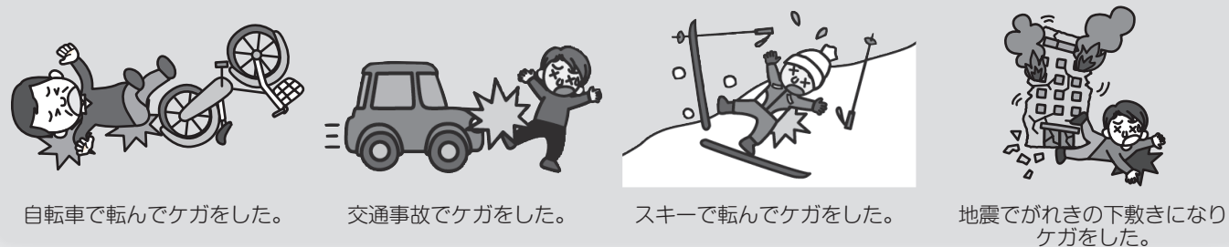
自転車で転んでケガをした。

このような場合に役立ちます！ 天災危険補償特約付きですので、地震や噴火、これらに起因する津波によるケガもお支払いができます。