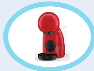
ネスカフェドルチェグスト ピッコロXS 10名様