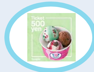
サーティワン アイスクリーム 500円ギフト券(1,000円分) 20名様