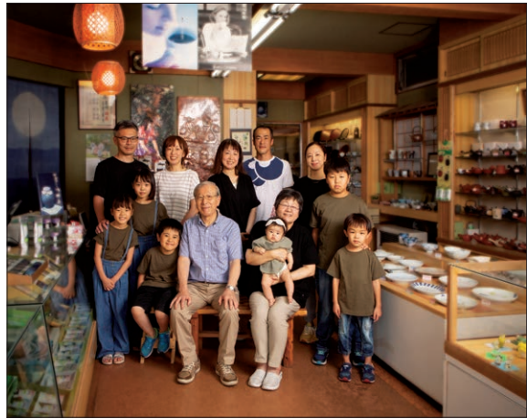
「お茶屋さんの家族写真」