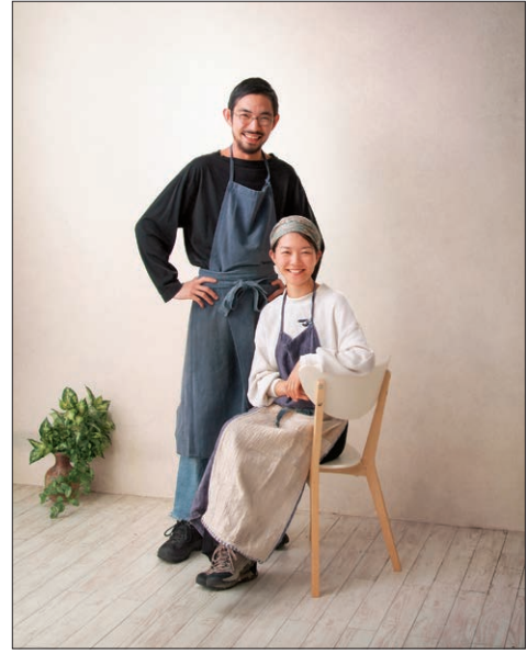
「ショップの二人」 吉田茂隆 吉田茂隆写真館（宮崎）