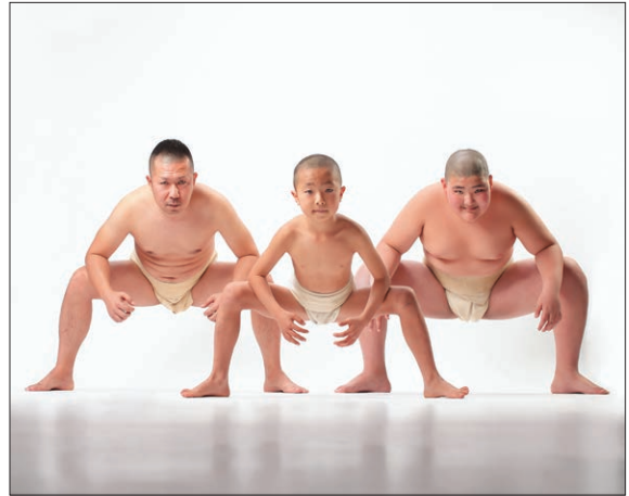
「家族ではっけよい」