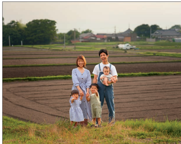
「家族の風景」 中西雅人 studio folk by 中西写真館（鹿児島）