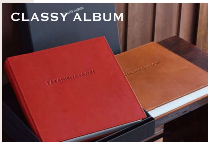
欧米で人気の洗練された商品