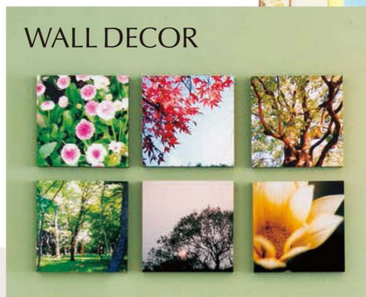
店頭の商品バリエーションが拡充