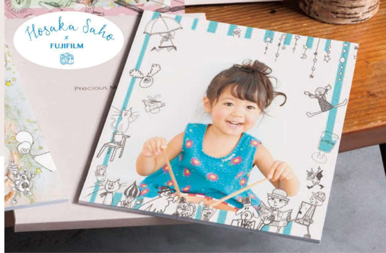
保坂さほコラボ商品